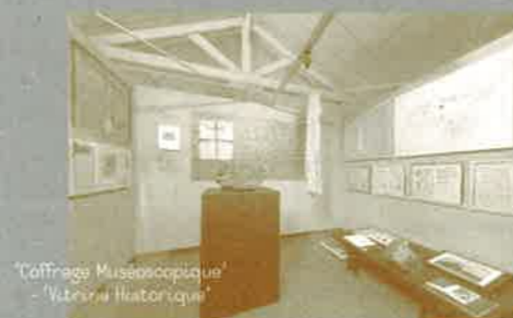
'Vitrine Contemporaine' - Salle II 'Vitrine Historique'