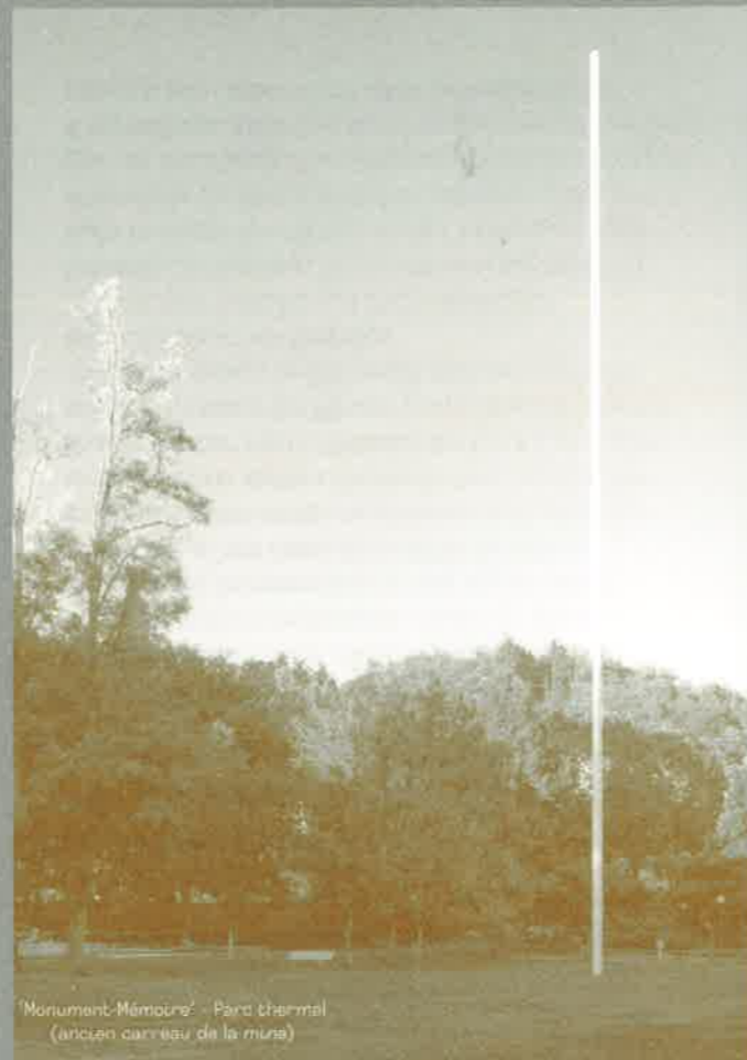
'Monument-Mémoire' - Parc thermal (ancien carreau de la mine)

MUSÉE DE LA MÉMOIRE - PROPRIÉTÉ UNIVERSELLE ®