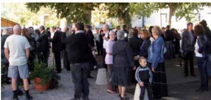
Le 15 Octobre 2011, accueil des invités autour d'une tasse de café. On note la présence de nombreux institutionnels et mécènes, une forte représentation de la Belgique et, plus inattendus, des galeristes de Vienne, Munich...