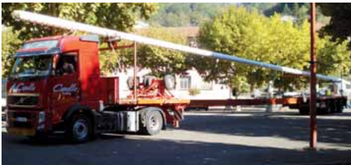
Le 13 Octobre 2011, fin de matinée, le long convoi de 44 mètres, parti très tôt de Fréjus, livre sur la place le monument mémoire.