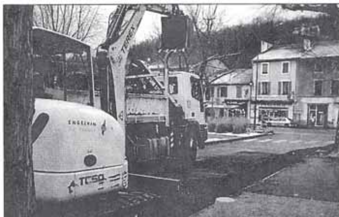
Ce sont bientôt 500 t de noyaux qui seront brûlés tous les ans.

Pour mémoire, le réseau chaleur dessert actuellement sur ses 1 800 mètres linéaires de tranchées (3 600 mètres aller-retour) les écoles primaires, Émile-Zola et Jacques-Prévert, la