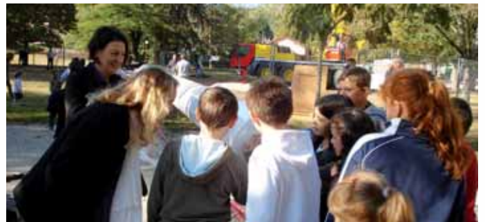
Le 14 Octobre 2011, avant d'être dressé dans le Parc, le monument mémoire est déballé. L'artiste invite les enfants des écoles à en prendre possession.