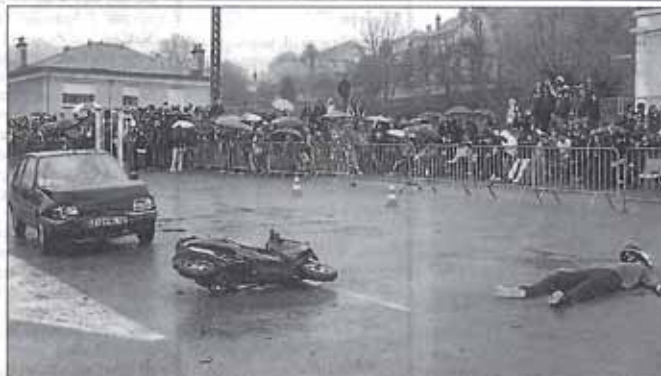
Deux types d'accident ont été mis en scène sur le parking de la gare d'Aubin.