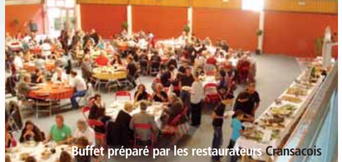
Buffet préparé par les restaurateurs Cransacois