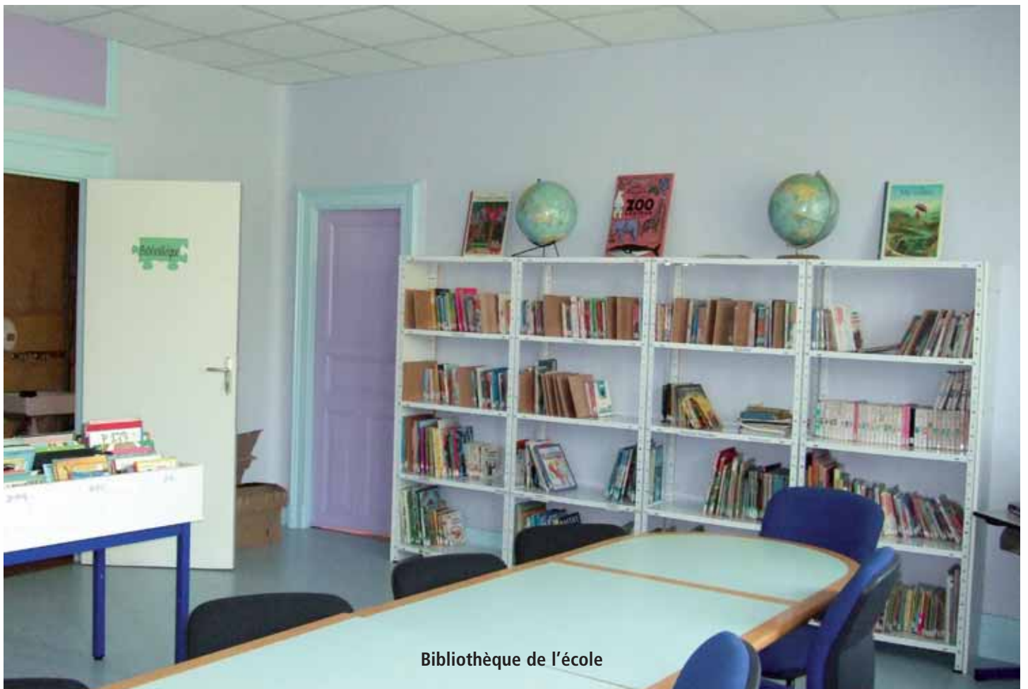
Bibliothèque de l'école

» Rencontre sportive gym pour les CP CE1 CE2 CM1 à CRANSAC.