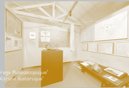
‘Coffrage Muséoscopique’ - ‘Vitrine Historique’