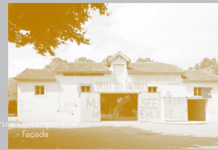
‘Vitrine Contemporaine’ - Façade

de Cransac ‘MUSÉE DE LA MÉMOIRE – PROPRIÉTÉ UNIVERSELLE ®’ » associe la réalisation d’une sculpture, le ‘Monument-Mémoire’ à deux ‘Vitrines’: deux espaces qui exposent les archives réunies au moment de l’étude puis de la réalisation de l’œuvre.