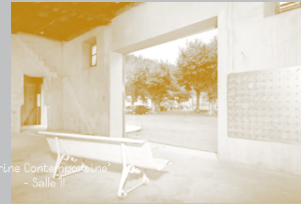
‘Vitrine Contemporaine’ - Salle II