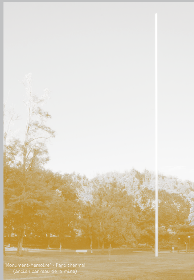
‘Monument-Mémoire’ - Parc thermal (ancien carreau de la mine)

‘MUSÉE DE LA MÉMOIRE – PROPRIÉTÉ UNIVERSELLE ®’