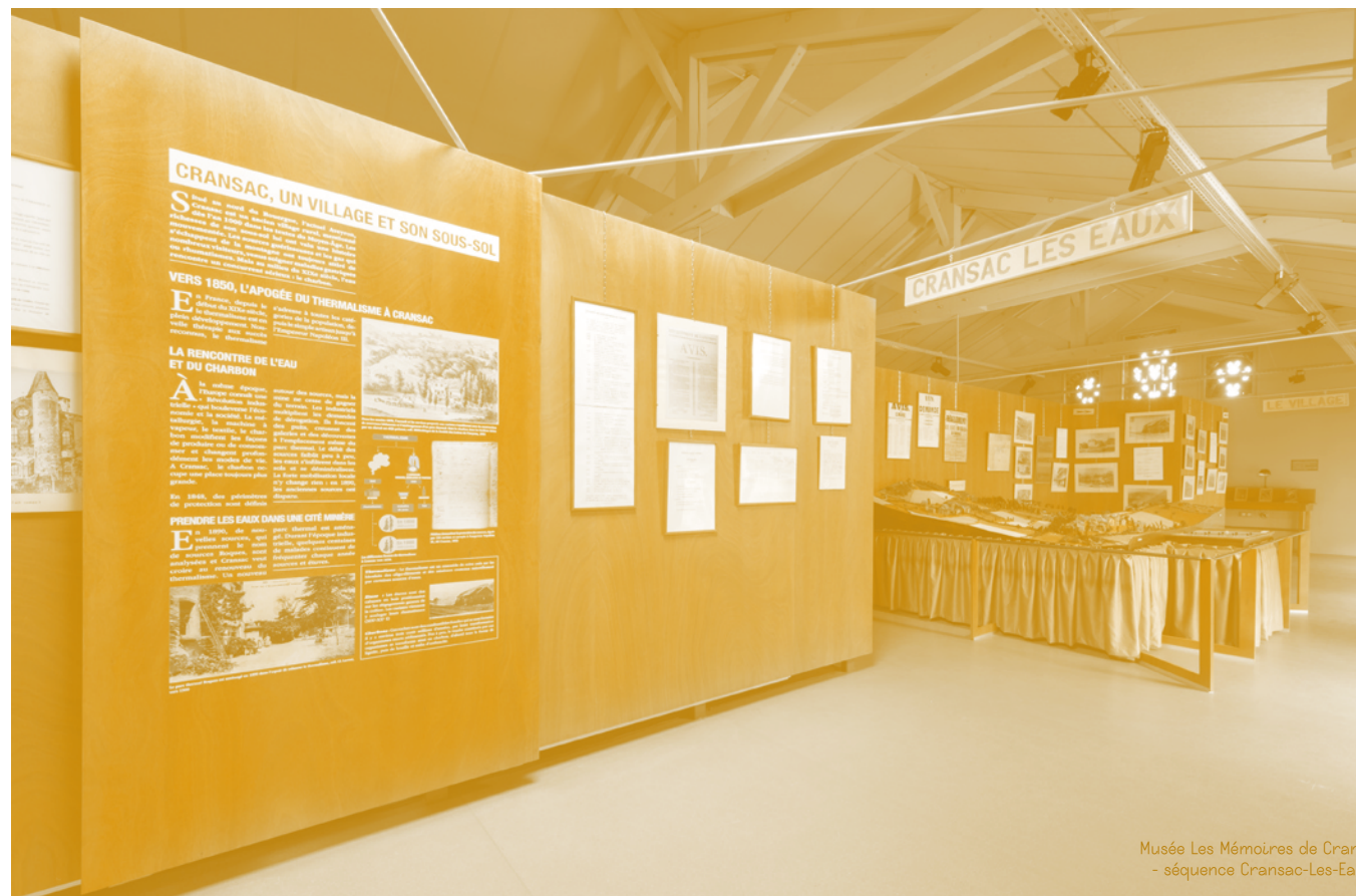
Musée Les Mémoires de Cransac - séquence Cransac-Les-Eaux